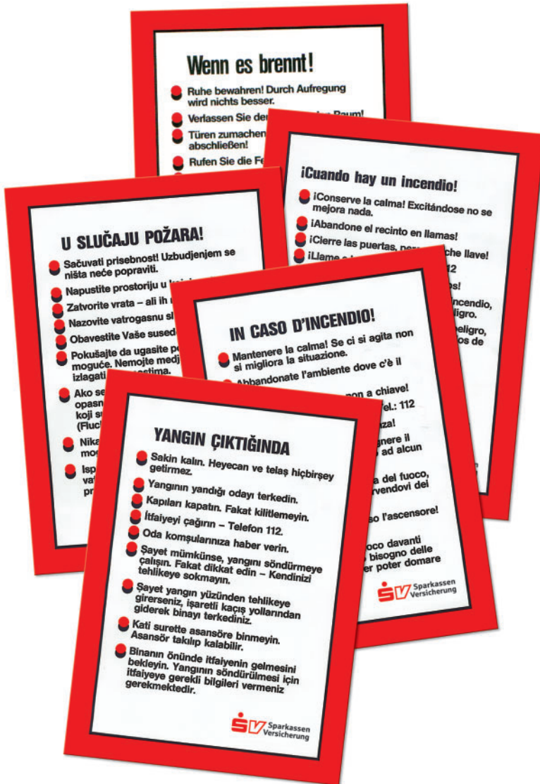
Flyer in verschiedenen Fremdsprachen