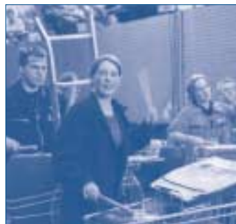
Mit dem Projekt »Hot Schrott Band« zeigt die Bürgerstiftung Hamburg erfolgreiche Gewaltprävention mit ungewöhnlichen Methoden.

Engagement. Doch nur wenn es praktikable Konzepte gibt, die es den Menschen ermöglichen, sich aktiv und verantwortlich für das Gemeinwohl ihrer Region einzubringen, wird die Bürgergesellschaft auch praktisch von engagierten Bürgern und Unternehmern mit Leben gefüllt. Ein solches Konzept, bei dem sich das Interesse an Eigeninitiative, Mitverantwortung und Kooperation in konkretes Engagement umsetzen lässt, ist die Bürgerstiftung. In ihr finden sich Privatpersonen, Unternehmer, Vertreter von gemeinnützigen Organisationen und andere zusammen, um gemeinsam das Gründungskapital aufzubringen und es durch das Einwerben von Zustiftungen zu vergrößern. So bauen sie gemeinsam das Dach, unter dem sie gemeinnützige Anliegen fördern und unterstützen, Dienstleistungen für Stifter, Spender und Ehrenamtliche anbieten und bürgerschaftliches Engagement vor Ort bündeln und vernetzen. Die Nachhaltigkeit dieses Engagements ist dadurch gewährleistet, dass das Stiftungskapital in seinem Bestand erhalten bleiben muss; operative und geförderte Projekte werden nur aus den Erträgen und aus Spenden fi-