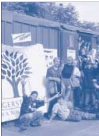
Mit Unterstützung der Bürgerstiftung Hannover nehmen Jugendliche des Jugendzentrums »Bauhof« in Wunsdorf bei Hannover ihren Bauwagen in Besitz.

Die Potenziale sind also vorhanden, sowohl die finanziellen Ressourcen als auch das persönliche