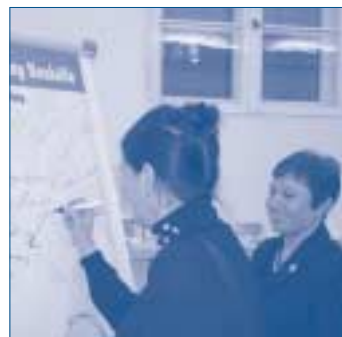
Im Berliner Bezirk Neukölln, in dem mehr als 300.000 Menschen aus 163 Nationen leben, wollen Bürger, Vereine und Unternehmen das friedliche Zusammenleben und die Lebensverhältnisse nachhaltig verbessern. Deshalb wollen sie in diesem Jahr die Bürgerstiftung Neukölln gründen.

Um diese innovative, nachhaltige Form bürgerschaftlicher Selbstorganisation zu unterstützen, sie bekannter zu machen und neue Initiativen zur Gründung solcher Stiftungen zu fördern, schreiben wir seit dem Jahr 2002 unseren Förderpreis Aktive Bürgerschaft für Bürgerstiftungen und Gründungsinitiativen aus. Die Resonanz bisher war groß: In den Jahren 2002 und 2003 gingen insgesamt 126 Bewerbungen ein; fünf Bürgerstiftungen und zwei Gründungsinitiativen wurden für ihr beispielgebendes Engagement mit dem Förderpreis ausgezeichnet. Eine Dokumentation der Förderpreise Aktive Bürgerschaft 2002 und 2003 ist im Februar 2004 erschienen. Hier werden u.a. die Preisträger beider Jahre vorgestellt. Es sind die Bürgerstiftungen Dresden, Dülmen, Fürstfeldbruck, Hamburg, Han-